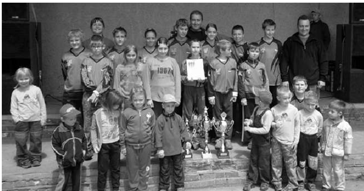
Starší žáci 1.místo, mladší žáci 2.místo a účast přípravky v Těšeticích