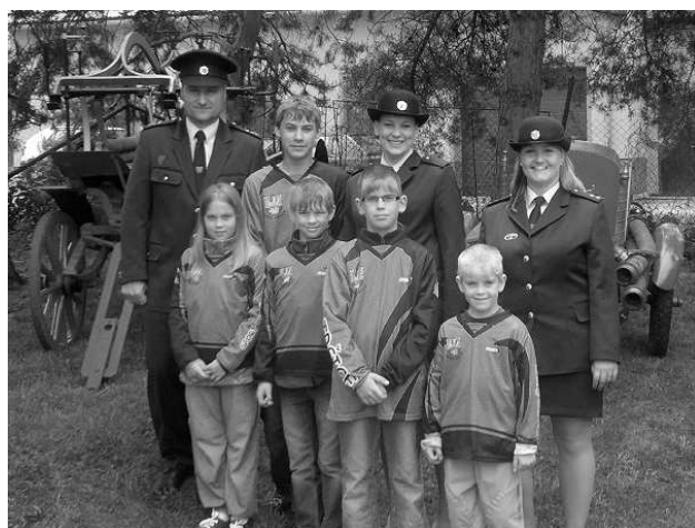
Oslavy k založení sboru v Doloplazích