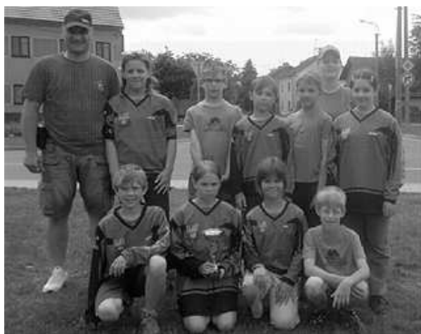
Mladší žáci 3.místo v Dolanech

S dosavadním průběhem sezony jsou spokojeni také vedoucí mladých hasičů. Dětem se zatím daří výborně, za to mluví i výsledky. Vždyť mladší žáci se drží na skvělém 5. místě z celkových 33 družstev. Hlavně aby jim forma vydržela i v září, za svou snahu by si zasloužily pěkné konečné umístění. Doufáme, že do nové sezóny děti dobře vstoupí branným závodem, který proběhne v říjnu.